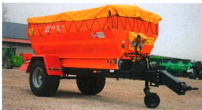
Zdjęcie nr 7 – Posypywarka PRONAR T132.

W 2024 roku zostały zakupione dwie nowe posypywarki ciągnięte T132 marki PRONAR. Dzięki nowemu sprzętowi zwiększy się jakość wykonywanych usług poprzez szybsze i bardziej równomierne rozprowadzanie materiałów sypkich, co pozwoli na skuteczniejsze odśnieżanie i zapobieganie oblodzeniom. Nowoczesne urządzenia zapewnią wyższą precyzję pracy, co wpłynie na poprawę bezpieczeństwa na drogach.