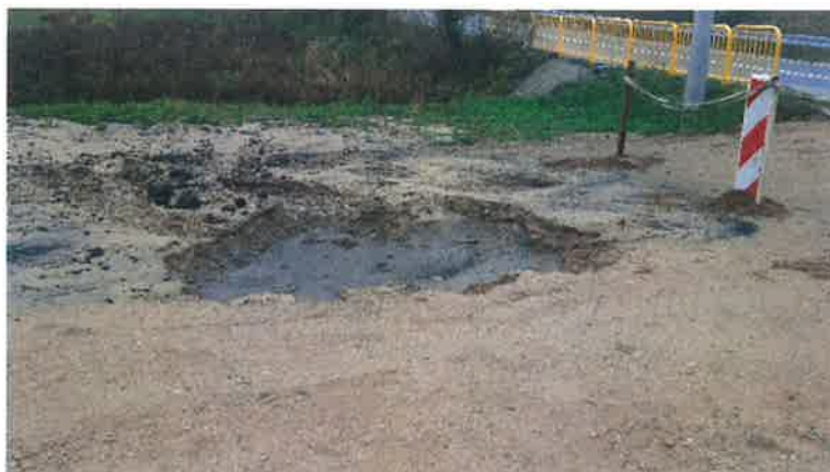
Zdjęcie nr 1 – awaria w miejscowości Lega, gm. Ełk.

Budowa nowego odcinka wodociągu zapewniła nieprzerwaną dostawę wody do mieszkańców miejscowości Lega, jednocześnie redukując konieczność regularnych i kosztownych napraw starej instalacji. Inwestycja ta przyczyniła się do zwiększenia niezawodności systemu wodociągowego oraz poprawy efektywności i utrzymania w kolejnych latach.