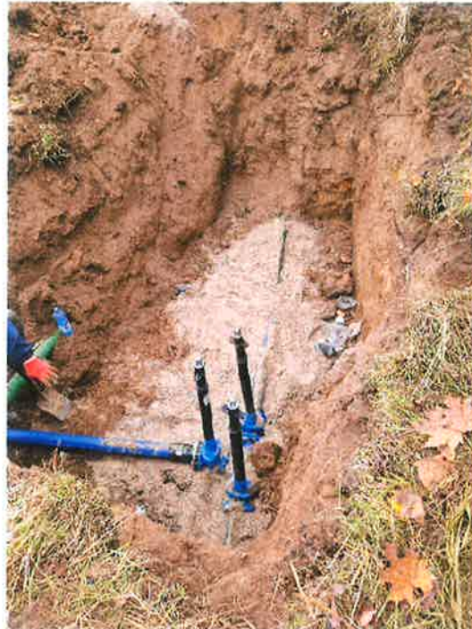
Zdjęcie nr 2,3 – naprawa awarii w miejscowości Lega, gm. Ełk.