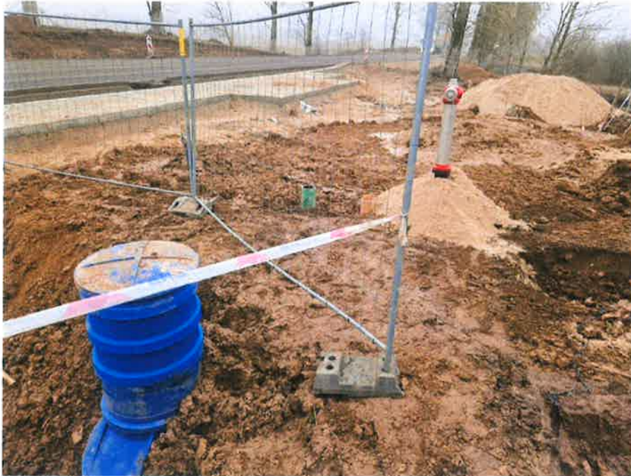
Zdjęcie nr 6 – hydrant w miejscowości Wityny, gm. Ełk.