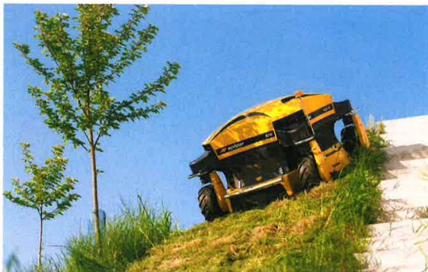
Zdjęcie nr 8 – Kosiarka Spider