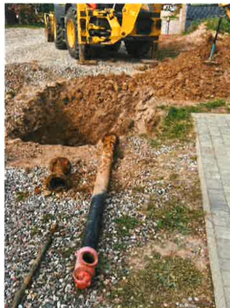
Zdjęcie nr 4,5 – hydrant w miejscowości Chruściele, gm. Ełk.